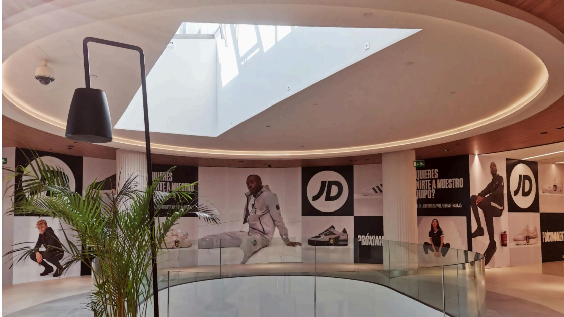
Tienda de JD Sports en la Gran Vía de Vigo.

El centro comercial Gran Vía de Vigo acogerá desde mañana, jueves 6 de abril , la tienda de JD Sports más grande de la provincia de Pontevedra, que ocupará más de 400 metros cuadrados en la planta uno de la superficie. La marca está especializada en calzado y ropa deportiva y distribuye productos de grandes franquicias como Nike, Adidas o Puma.