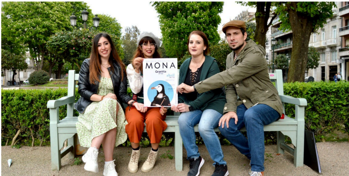
Parte del grupo de artistas que compondrán la primera edición del evento.

El Gran Vía de Vigo acogerá la primera edición del Mercado Mona , un nuevo mercadillo de arte e ilustración que se celebrará los días 14 y 15 de abril en la planta 0 del centro comercial. Se trata de una iniciativa cultural que nace con la vocación de ser referencia en el sector a escala local.