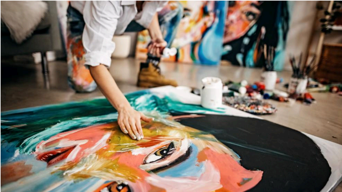
Un lienzo, en una imagen de archivo.

Vigo estrena su primer mercadillo de arte. Se llama MONA, en referencia a La Gioconda de Leonardo da Vinci, y su logo es una Mona Lisa con cabeza de gaviota, un símbolo de la costa olívica. El objetivo de esta cita es crear un espacio donde dar voz a los pequeños artistas e impulsar el arte en la ciudad.