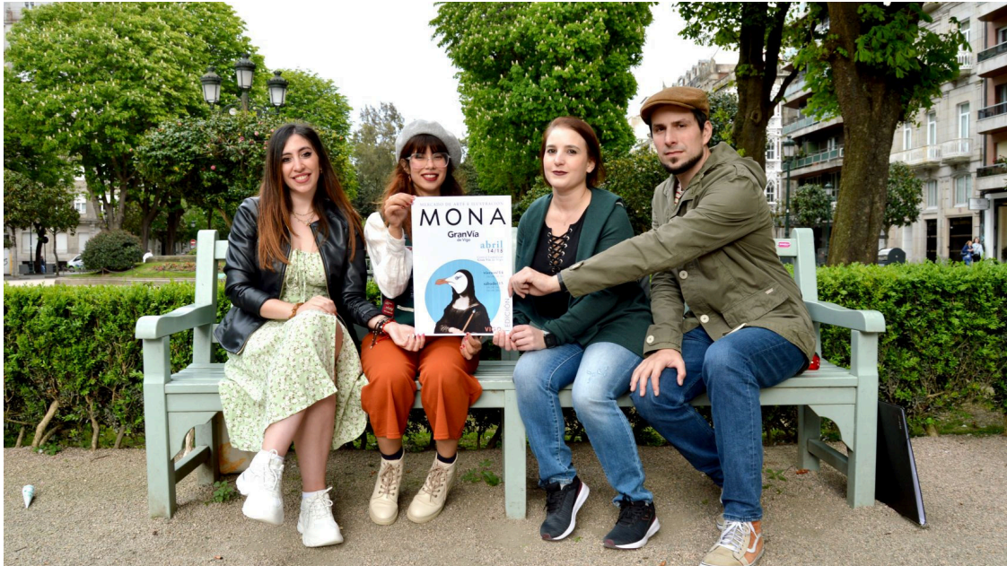
Participantes del Mercado Mona.