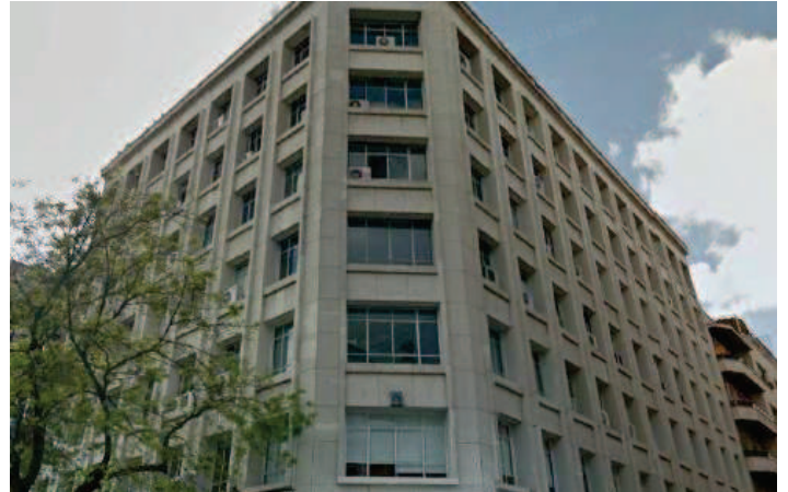
Vistas aérea y frontal del edificio adquirido por LRE