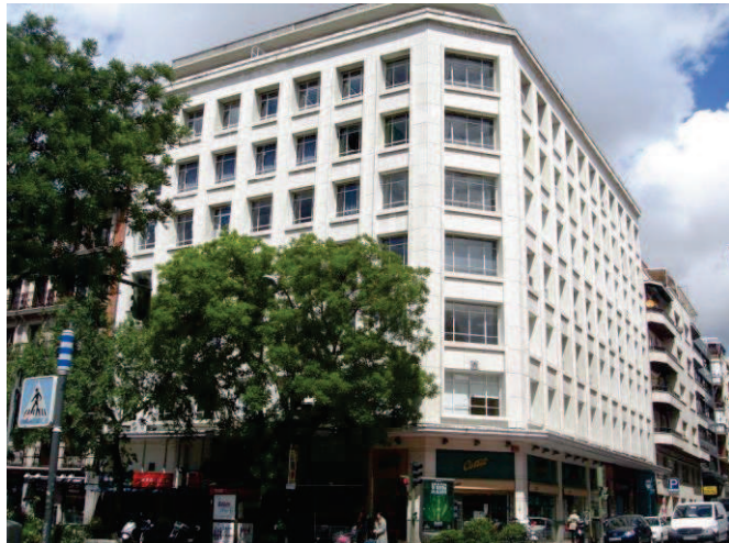
Vista frontal del edificio adquirido por LRE

El inmueble, construido en los años 60, cuenta con 6.232 m 2 de superficie bruta alquilable (SBA), distribuidos en nueve plantas, de los cuales más de 5.500 m 2 se encuentran sobre rasante. Las siete primeras plantas, con uso actual de oficinas, permiten su conversión a uso residencial. Asimismo, la planta baja y el sótano, que representan un 23% del total de la SBA, con 715 m 2 por planta, están alquiladas en su totalidad como locales comerciales.