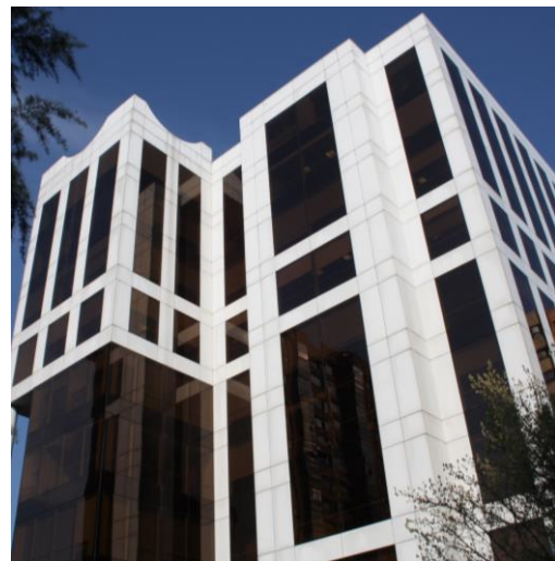
Exterior del Edificio

El inmueble cuenta con 8.663 m 2 de superficie alquilable sobre rasante, distribuidos en 9 plantas, así como con 193 plazas de garaje. Se trata de un edificio cuya construcción gira en torno a un amplio patio interior que confiere una gran luminosidad a las zonas interiores y destaca por el diseño, tamaño y flexibilidad de sus plantas que permiten optimizar el uso del espacio.