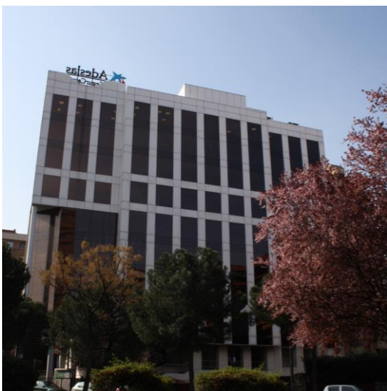
Fachada del Edificio

Esta nueva adquisición de la SOCIMI gestionada por Grupo Lar se une a la compra de los centros comerciales “Txingudi” en Irún y “Las Huertas” en Palencia el pasado mes de marzo y del edificio comercial ocupado por Media Markt en Villaverde, Madrid. Con ella el importe total invertido por Lar España asciende a 72,7 millones de euros, un 18% del capital captado en la salida a Bolsa. Se trata de una operación off-market y desembolsada totalmente con fondos de la compañía.